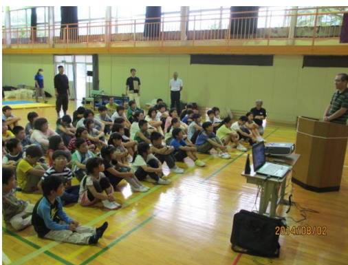
食育ワークショップ