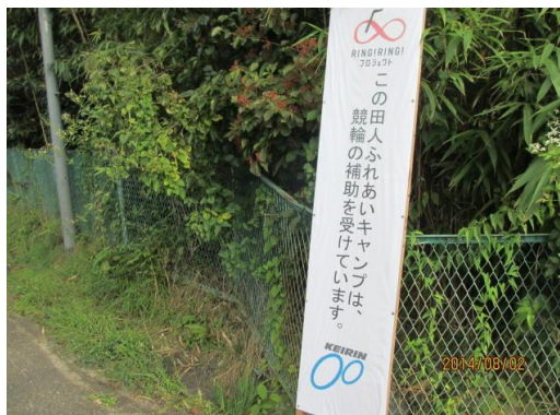
入り口へ設置した看板