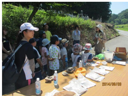
ストーンペイントワークショップ