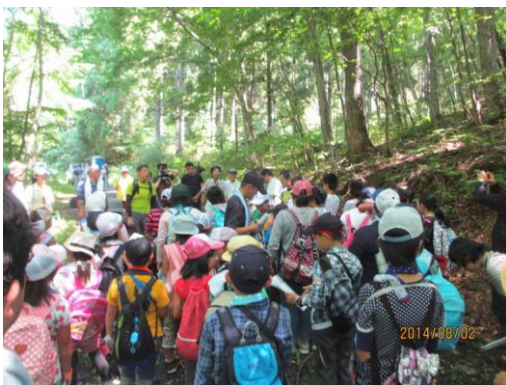
三株山ハイキング

田人ふれあいキャンプ ( http://www3.schoolweb.ne.jp/weblog/index.php?id=0710086 )