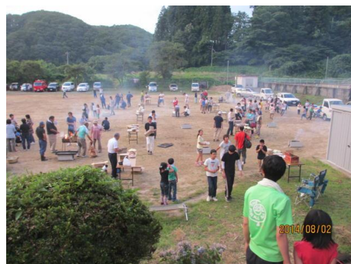
貝泊交流バーベキュー